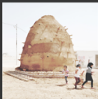
Emergency Architecture & Human Rights, Zafarani Classroom, Zafarani, Giordania 2015