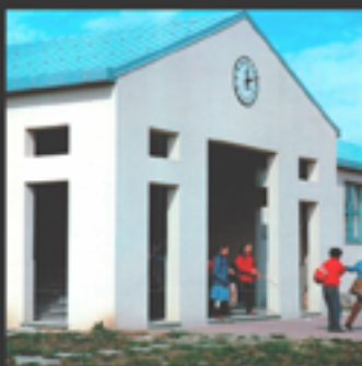
Prototipi di spazio collettivo. L'architettura delle scuole. Giornata di studio del PRIN "PROSA. Prototipi di scuole da abitare". Dipartimento di Architettura e Disegno Industriale dell'Università della Campania Aula T2, ore 10,30-11,30