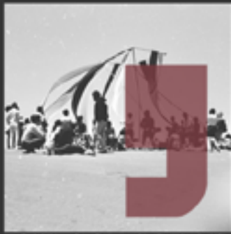
La Ciudad Abierta, Open City Inaugural Act, Riva, Salsomaggiore 1971