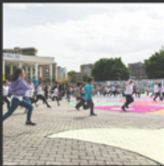
Prototipi di spazio collettivo. L'architettura delle scuole. Giornata di studio del PRIN "PROSA. Prototipi di scuole da abitare". Dipartimento di Architettura e Disegno Industriale dell'Università della Campania Aula T2, ore 10,30-11,30