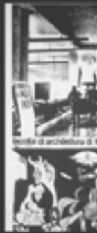
Monumento studentesco, O