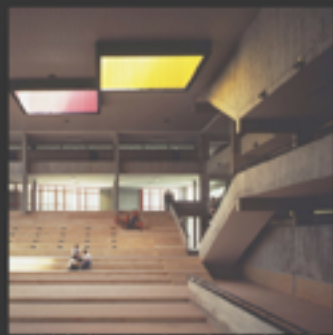
Emergency Architecture & Human Rights, Zafarani Classroom, Zafarani, Giordania 2015