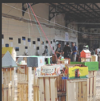
Geografie Extravaganti. Luoghi e percorsi dell'immigrazione, 2010