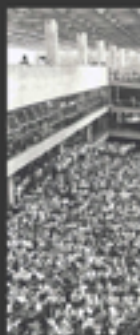
J. B. Villanova Artigas, Faculdade de Arquitetura e Urbanismo, São Carlos 1958-1964