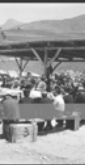
Prosecco a Portofino, 1965