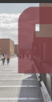
La Scuola, Coenza 1974