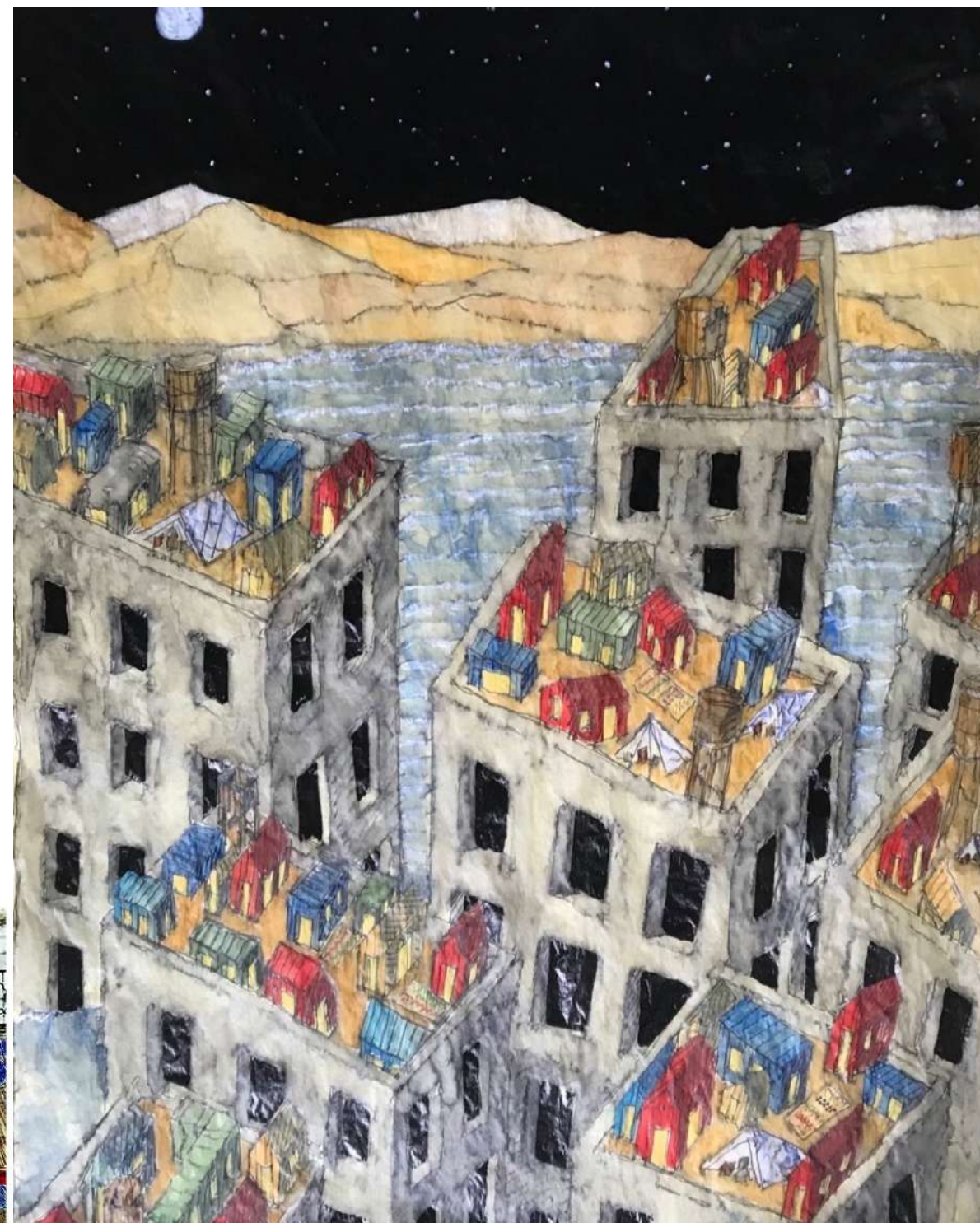
Alberto Ferlenga La città sopra 2023